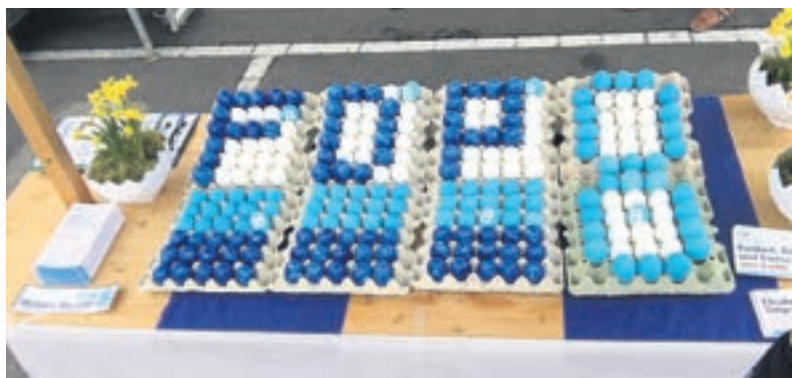
Wahlkampf 2016 – Ostereier im FDP-Blau am Ostersonntag in Müllheim am Stand.

Seit 25 Jahren bin ich im Vereinswesen engagiert und habe mit Freude als Leiter, Kassier, Präsident und OK-Präsident unterschiedliche Funktionen ausgeübt. Heute bin ich Vorstandsmitglied im Verein Berufsbe-