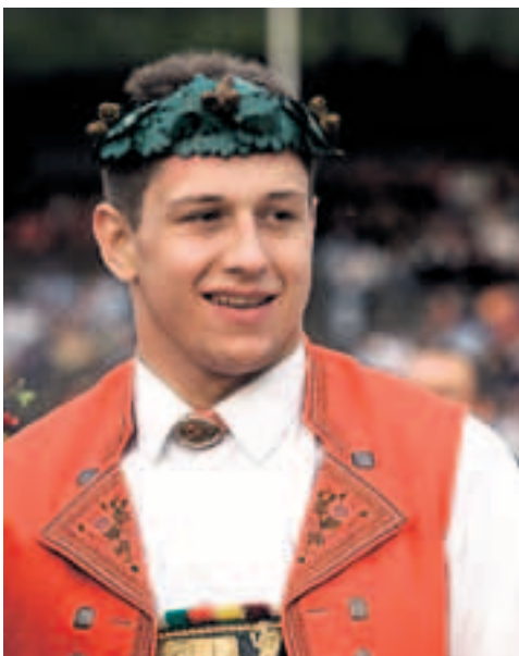
Hauptredner: Jörg Abderhalden, Schwingerkönig 1998, 2004, 2007

Samstag, 15. November 2014 ab 16.30 Uhr, Kartause Ittingen