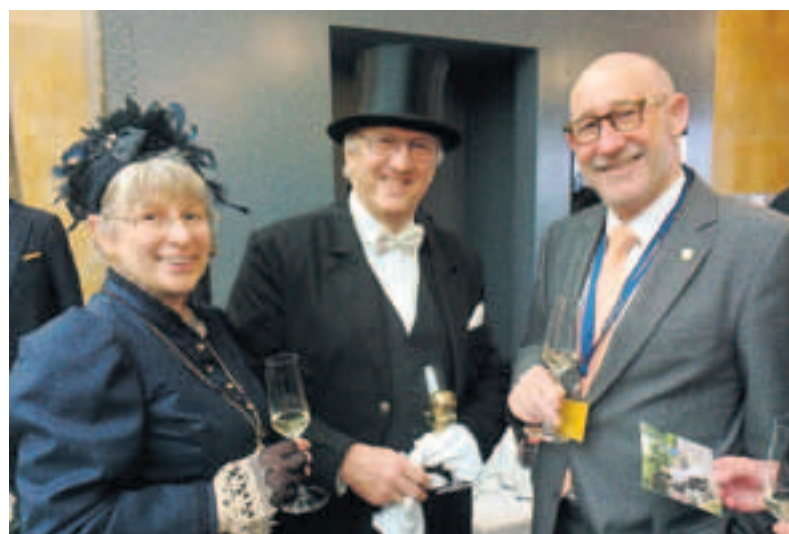
100 Jahre Dampfschiff Hohentwil.