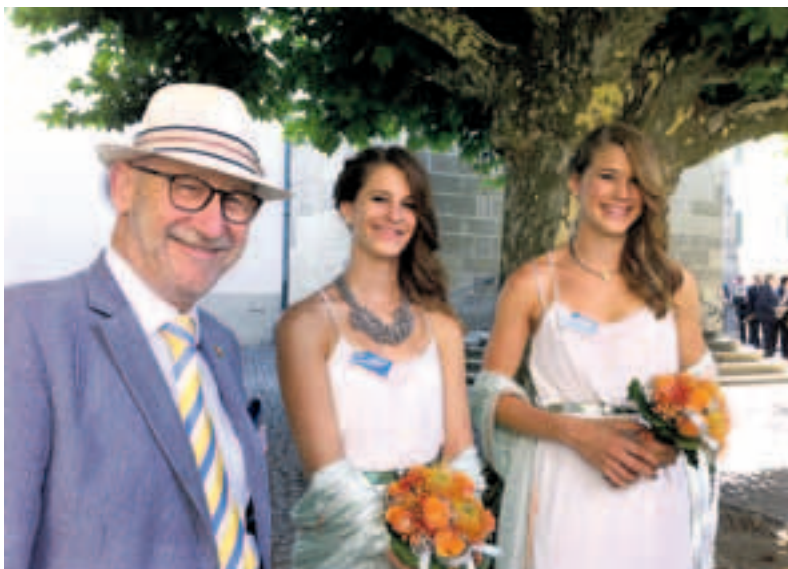
700 Jahre Stadt Steckborn.

Ich darf mit Stolz sagen, ein Jahr an der Spitze des Grossen Rates sein zu dürfen, ist in jeder Beziehung eine Herausforderung und gleichzeitig auch eine höchst ehrenvolle und erfüllende Aufgabe. Sie hat mir in jedem Moment sehr viel Freude bereitet. Ich würde es wieder tun.