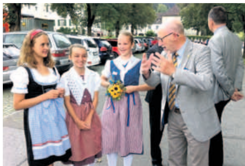
100 Jahre Musikverein Fisingen.