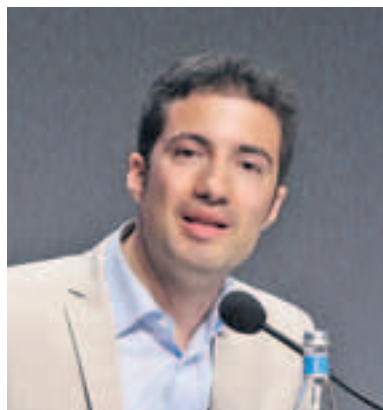
Nationalrat Andrea Caroni (FDP AR) berichtete aus Bern.

Andrea Caroni, Nationalrat FDP von Appenzell Ausserrhodon, stellte die Volksinitiative «Volkswahl des Bundesrates» vor. Die Delegierten folgten seiner Argumentation, dass eine Volkswahl des Bundesrates zu einem Dauerwahlkampf im amerikanischen Stil führen würde, der den Bundesrat als Gremium lähmen und das Parlament schwächen würde. Mit 57 NEIN und einer Enthaltung wurde die Volksinitiative klar abgelehnt.