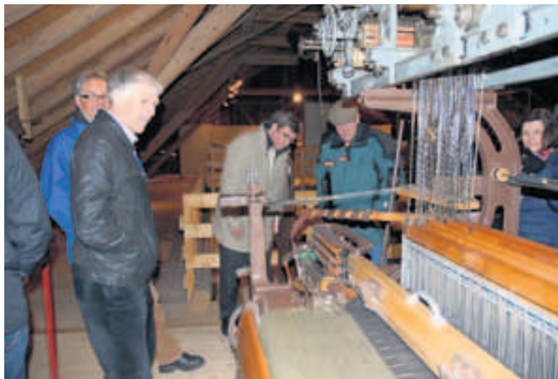
Die FDP-Mitglieder besuchten das Ortsmuseum Wängi.