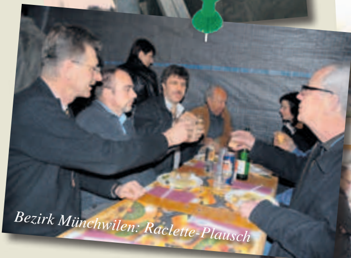
Bezirk Münchwilen: Raclette-Plausch