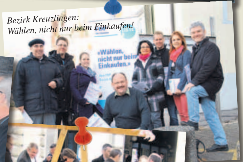
Bezirk Kreuzlingen: Wählen, nicht nur beim Einkaufen!