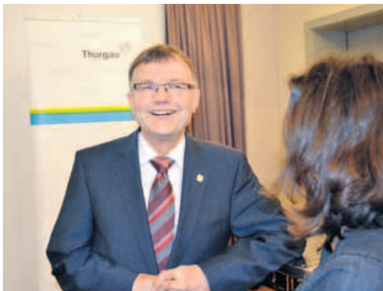
Im Wahlzentrum in der Kantonsbibliothek: die Freude des wiedergewählten Kaspar Schläpfer!