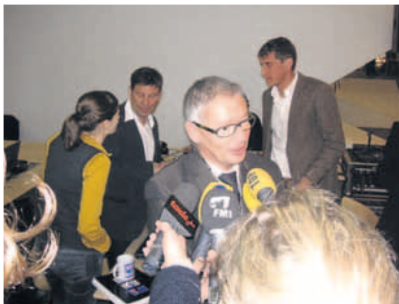
Ganz frisch gewählt: Medienrummel um den neuen St. Galler Regierungsrat Martin Klöti.