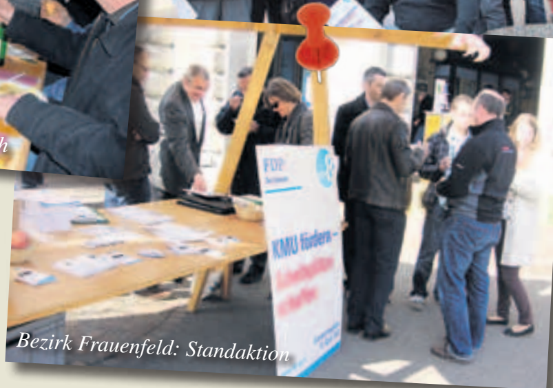
Bezirk Frauenfeld: Standaktion